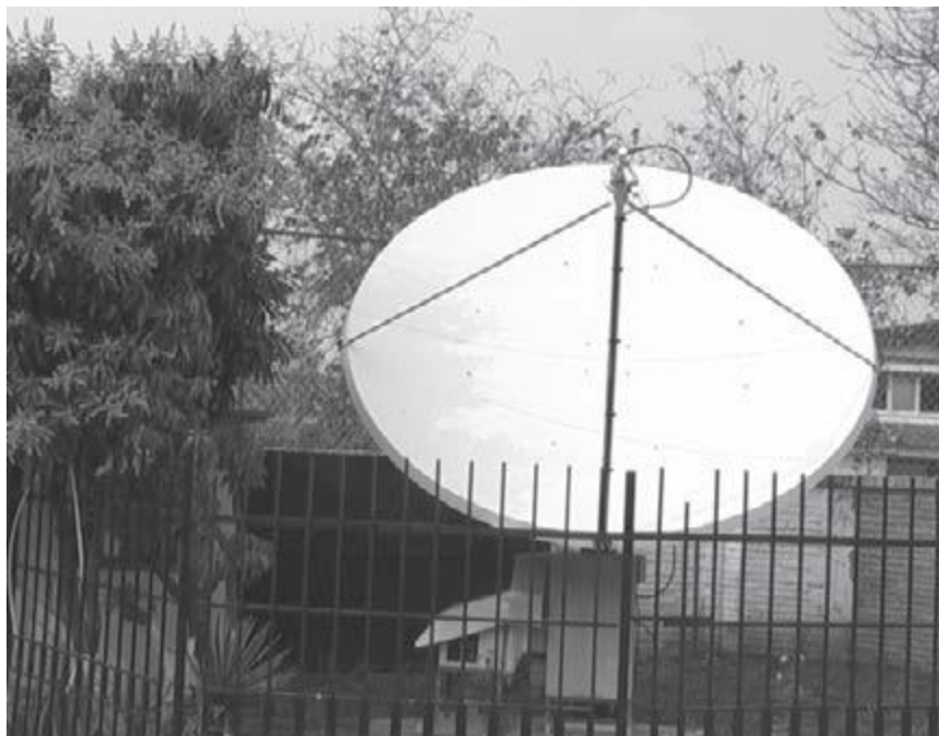
„Misa“ pro přenos signálu ADVenir na satelit. Bůh dále žehnal televizní síti se zařízením potřebným k vysílání Jeho poselství tisícům diváků po celé Bolívii.

Dne 21. dubna začal ADVenir vysílat svůj čtyřiaadvacetihodinový