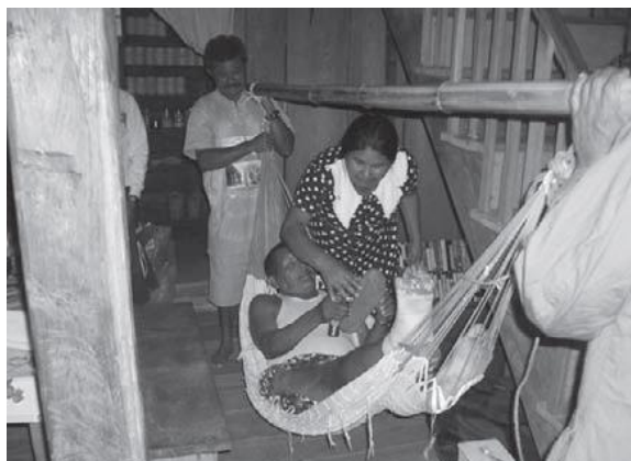
Transport muže, kterého uštkl jedovatý had labaria. Tento had je smrtelnou hrozbou guyanského pralesa.

San Juan, vesnička na druhé straně řeky ve Venezuele, potřebovala modlitebnu. A tak členové z Kaikanu šli dvě hodiny pěšky, aby pomohli. Konstrukce domů ve vnitrozemí Guayany se velmi liší od způsobu stavění v Severní Americe. Nejdříve stavitelé pěšky putují džunglí, často celé hodiny, aby našli vhodné stromy. Potom je porazí řetězovými pilami, rozřezou je na klády a nakonec na desky. Těžké, tvrdé dřevo je rozřezáno