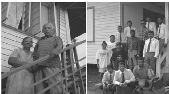
Díky velkorysosti tohoto páru, který daroval své jmění, aby mohla být v Kimbii vystavěna misijní akademie, a nadšenému úsilí počátečního stavebního výboru se škola stala skutečností.

Protože Warren věděl, jak dlouho potrvá dopravit třicet devět tun