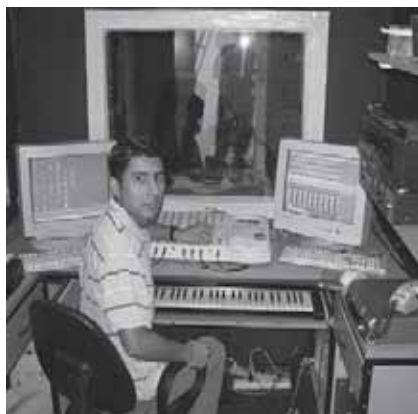
Studio Advenir v Santa Cruz v Bolívii

Televizní síť začala vysílat pro celou Bolívii se svým počátečním zařízením v září 2002