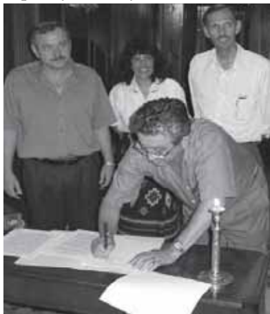
Formální podepsání kontraktu prodeje televizní sítě služebnosti Gospel Ministries International dne 31. ledna 2002 po řadě vyjednávání.