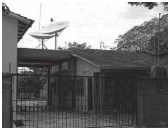
Vchod do budovy ADVenir s kanceláři v Bolívii

vysílací prostory každý den v době hlavního vysílacího času.“