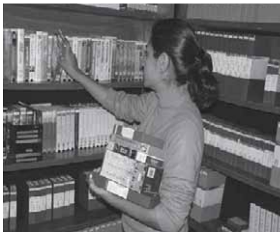
Sbírka videopřednášek, studií a jiných materiálů ve studiu ADVenir. Noční programy poskytovaly hlubší studium pravd Písma.

svobodná matka rozhodla, že již nemá smysl dál žít a chtěla zabít svou malou dcerku a potom i sama sebe. Dcerka však „náhodou“ nalaďila televizor na ADVenir. Když matka uslyšela příjemnou, pokojnou hudbu, přišla se podívat, co její dcera sleduje. Promlouval evangelista, Alejandro Bullón, přímo k ní? Když byl program u konce a na obrazovce se objevilo pozvání ke sledování dalších programů,