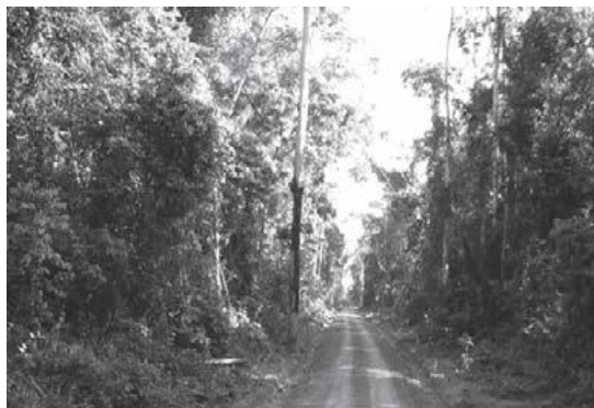
Jeden z dalších Božích „misijních zázraků“ – nová silnice vedoucí k Technickému učilišti Richarda Gatese