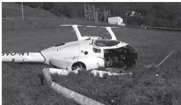
Selhání hydrauliky způsobilo nouzové přistání Svena, jež vyústilo v těžkém poškození helikoptéry.

„Ano,“ řekl David. „Jednoho dne prohlížel časopis a tam uviděl turbínovou helikoptéru. Cítil, že ho Bůh navedl na tyto stránky, aby se rozhodl, že takovou helikoptéru bude jednoho dne mít.