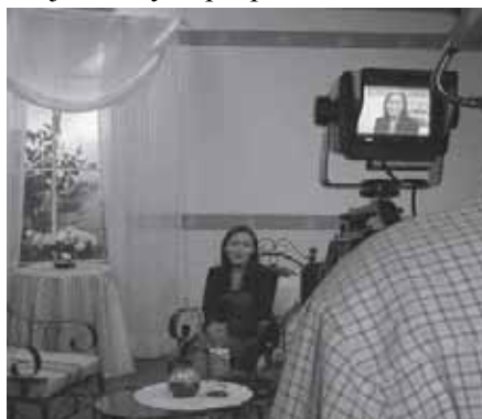
Zrod společnosti Red ADVenir (španělské adventní televizní sítě)