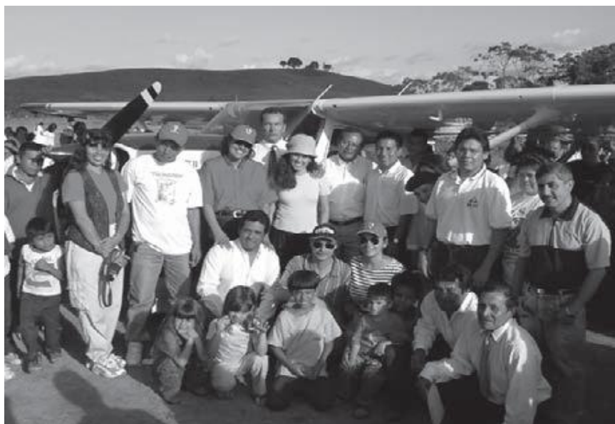
K zasvěcovací bohoslužbě se dostavilo mnoho lidí. Jeden starší muž položil ruku na křídlo letadla a děkoval Bohu za pomoc, kterou tento letoun přinese jeho vesnici.