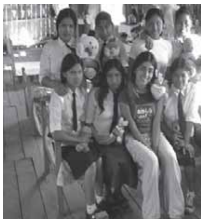
Studentky v dívčí ubytovně Technického učiliště Richarda Gatese v Guayaramerinu v Bolívii.