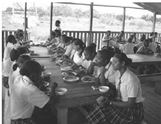
Oběd ve školní jídelně

klopených nádhernou přírodou. Všechny tyto budovy – hlavní administrativní budova, budovy chlapeckých a dívčích ubytoven, dva domovy pro rodiny misionářů, kuchyni s jídelnou a budovu ošetrovny a přírodních věd – ty všechny byly postaveny misijním personálem, studenty, místními obyvateli a misijními skupinami. Úchvatné vý-