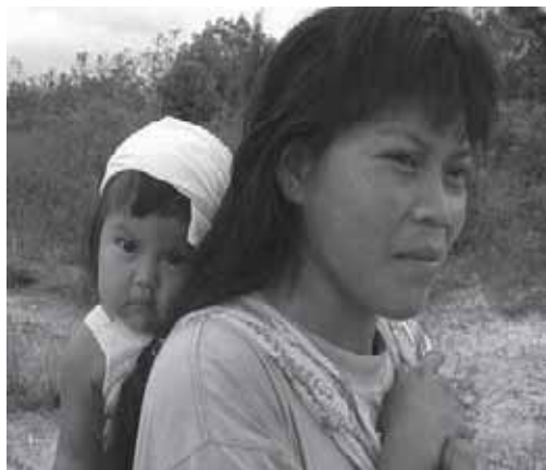
Matka s dítětem ve vesnici Arau. Mnozí z vesničanů měli obavy z duchů a jejich vlivu na jejich každodenní život.