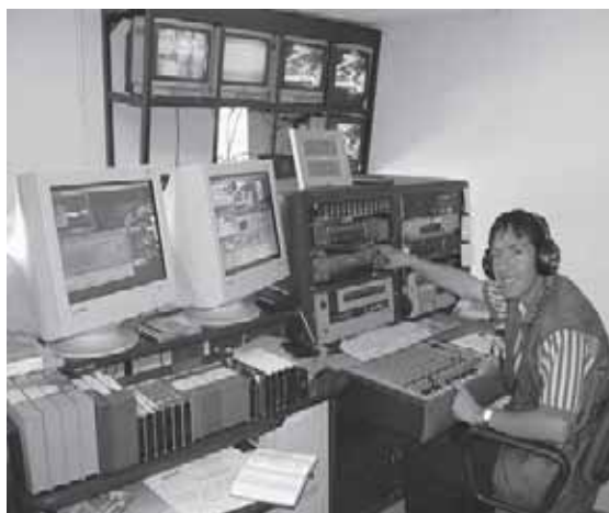
Původní kontrolní studio ADVeniru v Santa Cruz v Bolívii

péči, jakou jsi nám doposud prokazoval. Nyní se dožadujeme Tvého zaslíbení z Žalmu 46,11: „Upokojtež se a vězte, že já jsem Bůh, kterýž vyvýšen budu mezi národy, vyvýšen budu na zemi.“ A protože nás povoláváš k tomu, abychom se upokojili, zvolili jsme si uposlechnout přesně tak, jak to říká tento Žalm. Nebudeme pokračovat