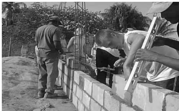
Dílo na první školní budově v Kimbii pokračuje.