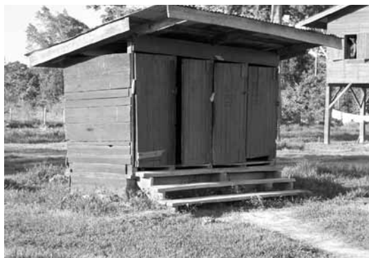
Záchod akademie v Kimbii

Znovu podebral dítě hráběmi a pomalu, což se zdálo jako celá věčnost, přibližoval dítě na hrábích zpět k otvoru. Tentokrát se Jodi podařilo dítě uchopit a pevně ho držet. Ignorovala ten smradlavý materiál,